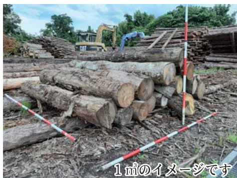
1 m 3 のイメージです