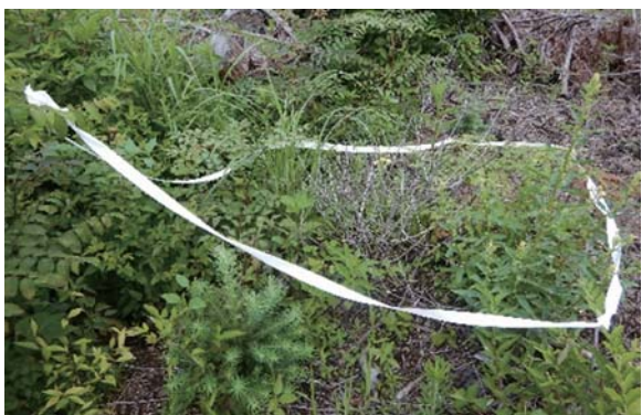
ハチの巣を見つけたときは印をしましょう

うにしましょう。山での作業時には長袖・長ズボン必須ですが、裾を靴下に入れる、首にタオルを巻くなど肌の露出を極力無くすることで、マダニやカ、ウルシ対策になります。また、ディートやイカリジンという成分を含む虫除けはマダニやカに効果的とされています。積極的に使いましょ。さらに、イノシシ、マムシ、アシナガバチなど注意した方が良い生き物があるか調べ、適切な対策をとることが重要です。